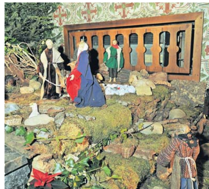
Zehn Krippen in Kirchen (Foto links: St. Sebastian, Lobberich) und Kapellen (Foto rechts: Krankenhaus, Lobberich) sind beim Krippenweg geöffnet.